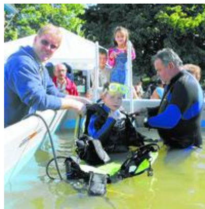
Tauchen wie die Profis - beim Kinderfest gab's jede Menge zu entdecken und auszuprobieren.

Wie in einem großen Spielpark präsentierte sich gestern die Grundschule den vielen Besuchern. In entspannter Atmosphäre kamen die Familien voll auf ihre Kosten, denn für die Spiel- und Bastelangebote musste nichts bezahlt werden. Nur die Verpflegung kostete Geld, sie war aber mit familienfreundlichen Preisen den Bedürfnissen beider Seiten angepasst. Einerseits sollten die Eltern nicht zu stark belastet werden, andererseits brauchen die Vereine die Einnahmen zur Finanzierung ihrer Arbeit. Im Gegensatz zu den